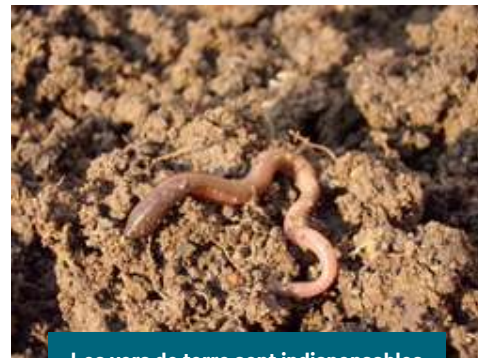
Les vers de terre sont indispensables pour aérer le sol

La préservation d'une continuité écologique dans le sol paraît essentielle. C'est pourquoi le concept de « trame brune » est apparu, sur le modèle des trames vertes et bleues mais appliqué à la continuité des sols. En ville, il est donc aujourd'hui crucial de réfléchir au maintien d'espaces de pleine terre aussi continus que possible.