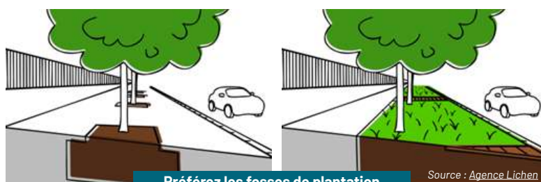
Préférez les fosses de plantation continues lors de la plantation d'alignement

Réfléchir les aménagements pour conserver au maximum les surfaces perméables : comme dit le proverbe, mieux vaut prévenir que guérir. Ainsi, il est beaucoup plus économique de conserver les sols en bon état plutôt que d'essayer de les reconstituer une fois détruits. Il est aujourd'hui essentiel de préserver les espaces de pleine terre et d'artificialiser seulement lorsque la nécessité est réelle. Par exemple, lors de la plantation d'un alignement d'arbres, créer des continuités entre les fosses de plantation sera bénéfique aussi bien pour la biodiversité du sol que pour les arbres. C'est un investissement pour l'avenir, les arbres évoluent dans de meilleures conditions (espace souterrain disponible plus important, sol plus riche, mycorhizes), ils sont donc en meilleure santé et moins sensible au changement climatique et aux maladies et ravageurs dont ils sont en partie protégés grâce à la biodiversité du sol.